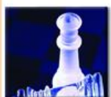
P.O.Box : 925145 Al Abdali - 11190