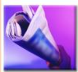
Jordan - Amman