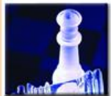
P.O.Box : 925145 Al Abdali - 11190