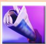
Jordan - Amman

نحن نعمل منذ 2003 في تخصص تصميم مواقع الإنترنت ، و لدينا العديد من الزبائن داخل و خارج الأردن ، و نحن نفخر بكل زبائننا و نستطيعهم عذراً فلن نستطيع ذكرهم جميعاً في عروضنا .